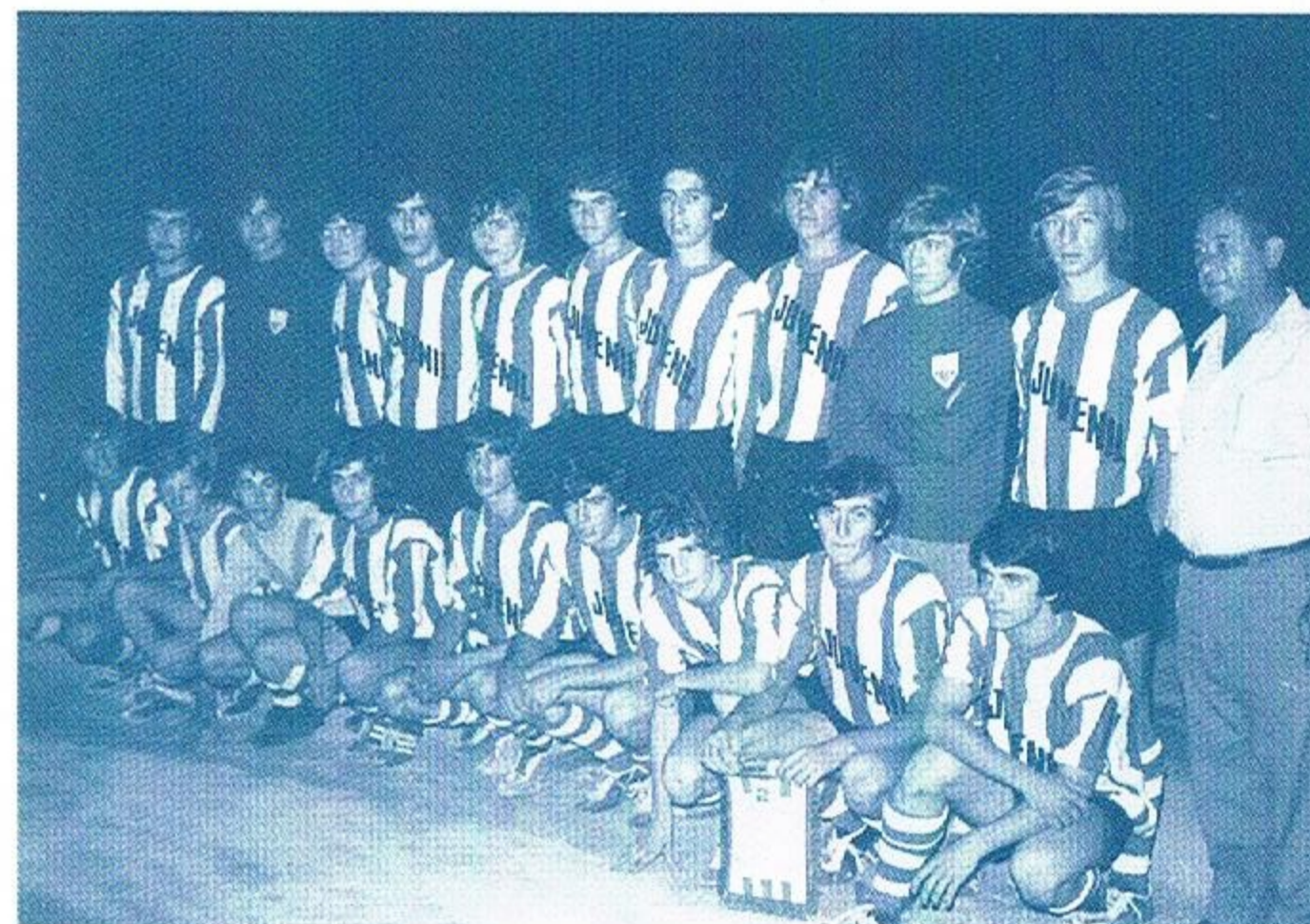
Montuiri juvenil II edició

Juvenils grup A (Divisió d'Honor i Lliga Autònoma): Atlètic Balears Cide La Salle La Victòria Mallorca Penya Arraval Platges Calvià P. Ramon Llull Cadets grup B: Beta Independent Montuiri Portocristo Juvenils grup B: Beta Montuiri Portocristo Sóller Infantils grup A (I regional): Atlètic Balears Cide La Victòria Penya Arraval Cadets grup A (I regional): Cide La Salle Mallorca Platges de Calvià Infantils grup B: Algaida Beta Montuiri Sa Indioteria Alevins: Algaida Montuiri Sa Indioteria Sóller