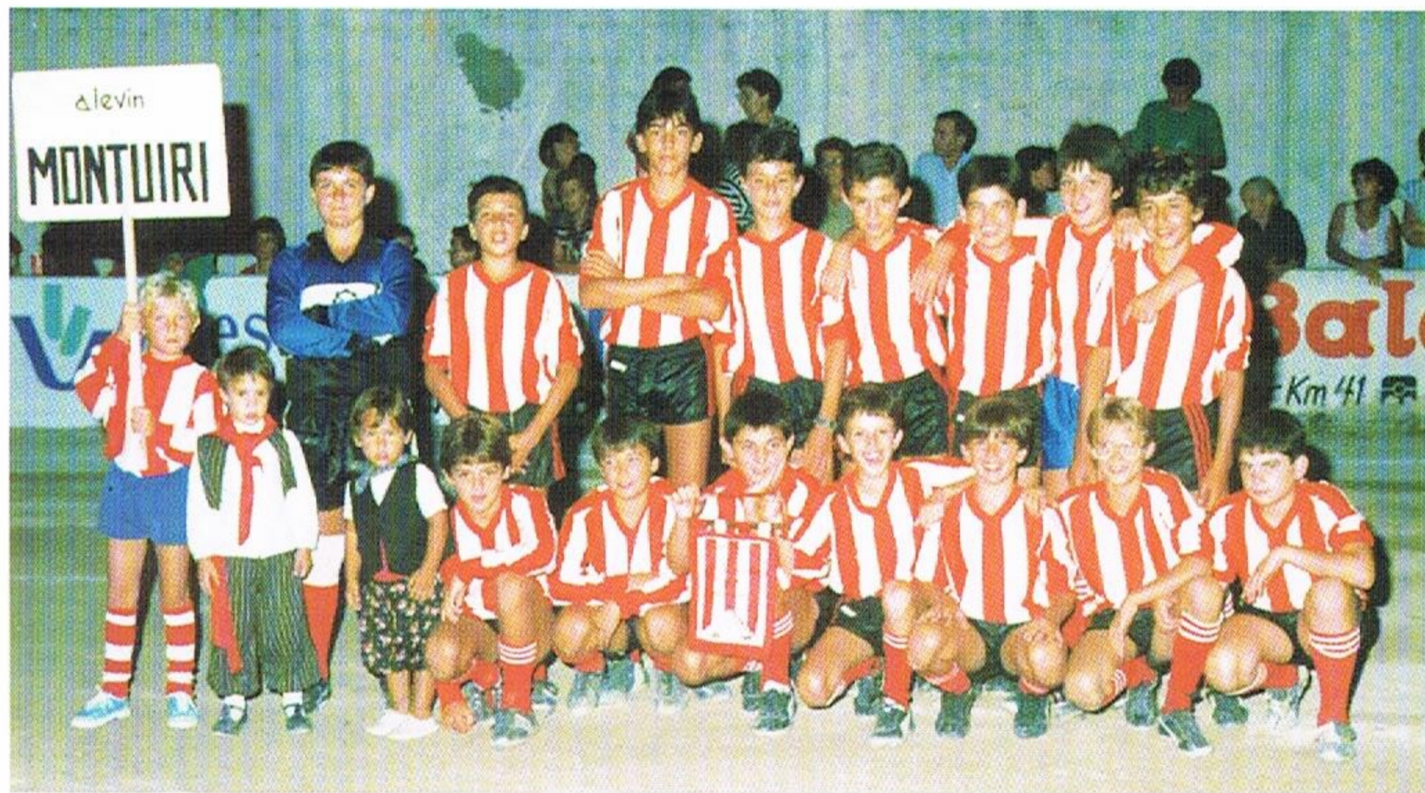
Aleví • XV edició 1987