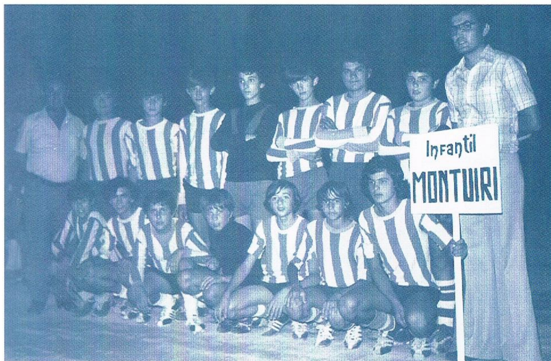
Montuïri Infantil • II edició (1974)

Les característiques de la competició i la tradició assolida han propiciat que el torneig de la Llum (o "la Luz de Montuïri" com algú de Palma deia a causa del nom inicial de "torneo de la