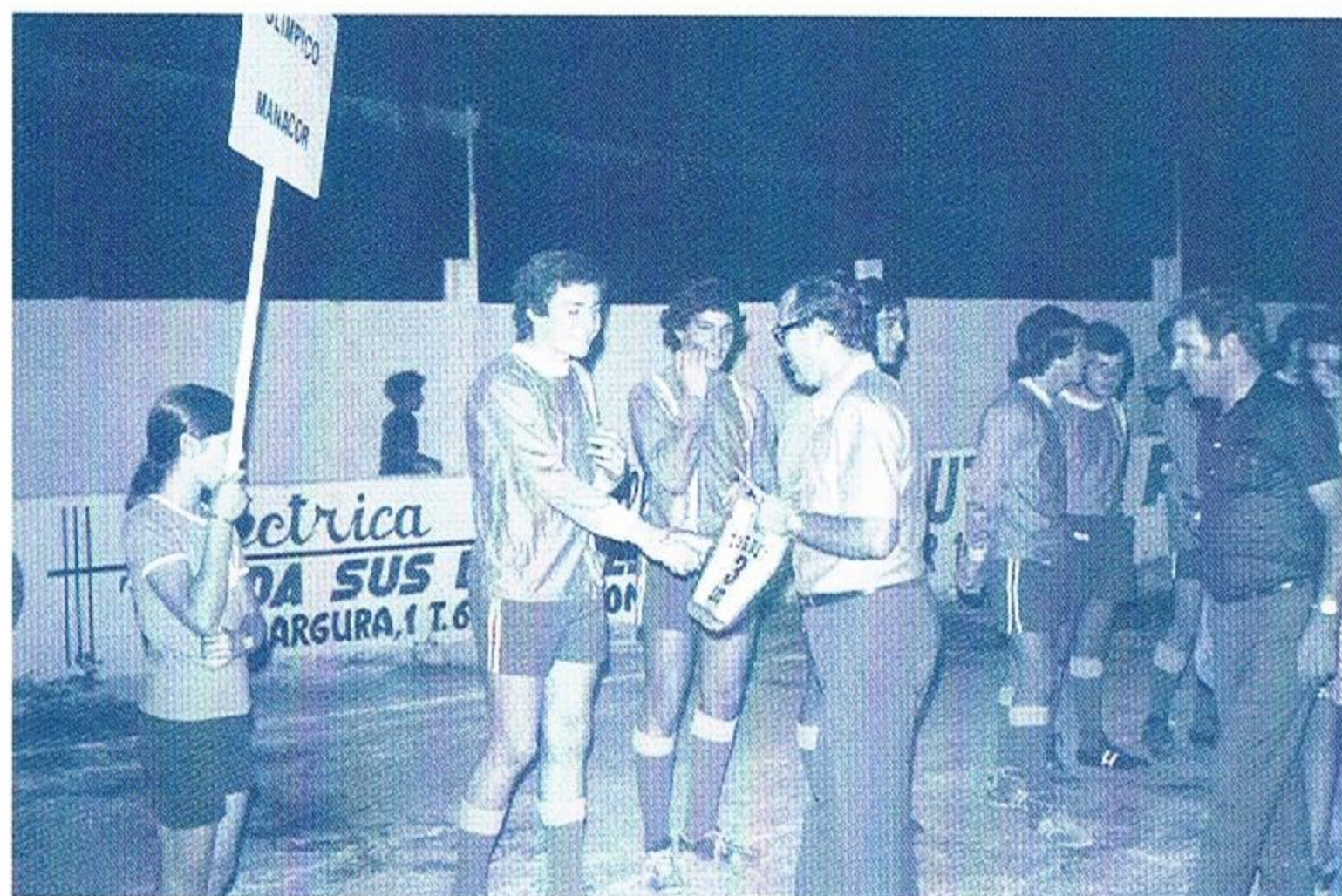
Lliurament banderins 3 a edició