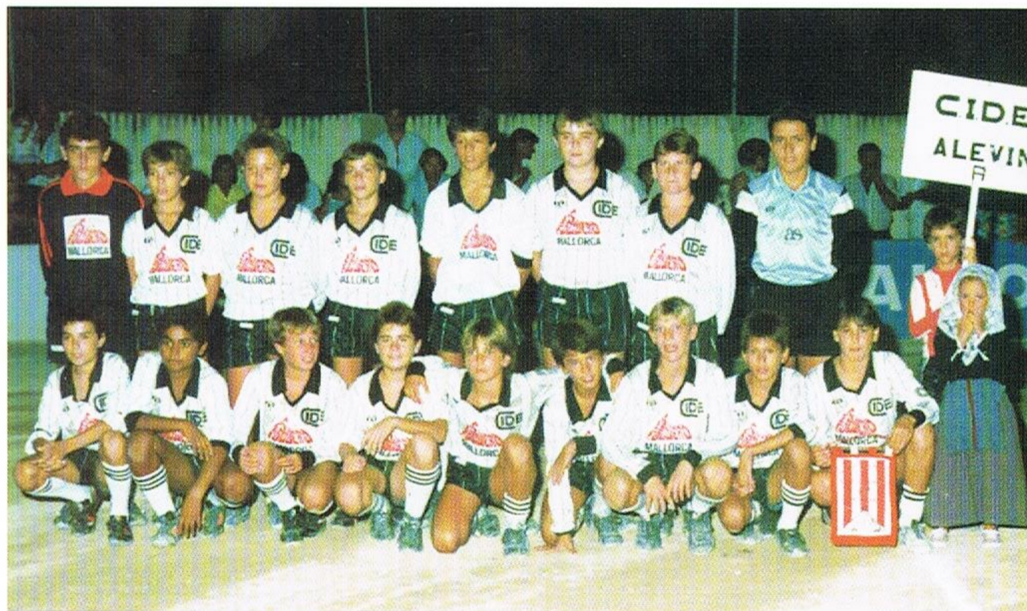
El col·legi Cide va ser cofundador. Els alevins foren campions a la XV edició (1987)