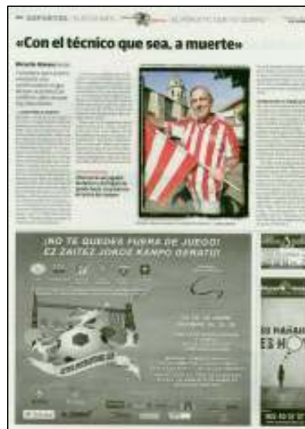
ANUNCIO 20 MÓDULOS. 25/06/2011