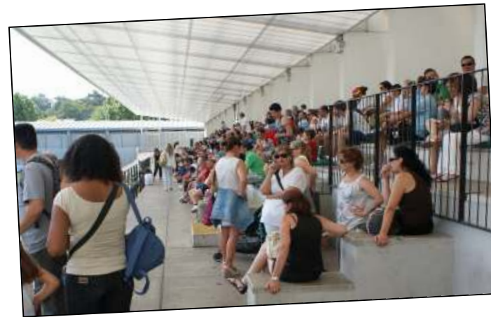
Getxo International Cup atrajo a más de 10.000 personas durante los tres días en que se ejecutó el proyecto

Ajax de Ámsterdam, F.C. Barcelona, Atlético de Madrid y Real Zaragoza, encabezaron la nómina de clubes participantes. Con estos equipos se midieron, además de los dos principales clubes de Getxo (Arenas-Romo y C.D. Getxo), escuadras del resto del resto de Bizkaia (Gernika, Moraza, Leioa, entre otros) y Euskadi (Antiguoko, Ariznabarra, Kotskas, Lakua, entre otros) y de otras comunidades autónomas, como Cantabria (Bansander, Perinés y Castro), Madrid (A.D. Naya), etc. Por la cantidad y la calidad de los equipos participantes, Getxo International Cup cumplió con su objetivo de ofrecer un importante nivel deportivo, situándose ya desde esta edición como uno de los principales torneos de fútbol infantil del Estado.