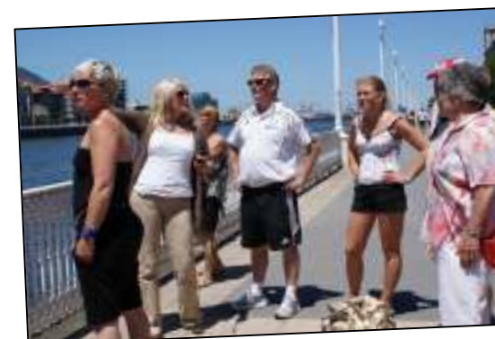
Técnicos y familiares de los jugadores del Ajax de Ámsterdam en una de las visitas guiadas organizadas por GEYC a zonas con presencia de empresas y turísticas del municipio