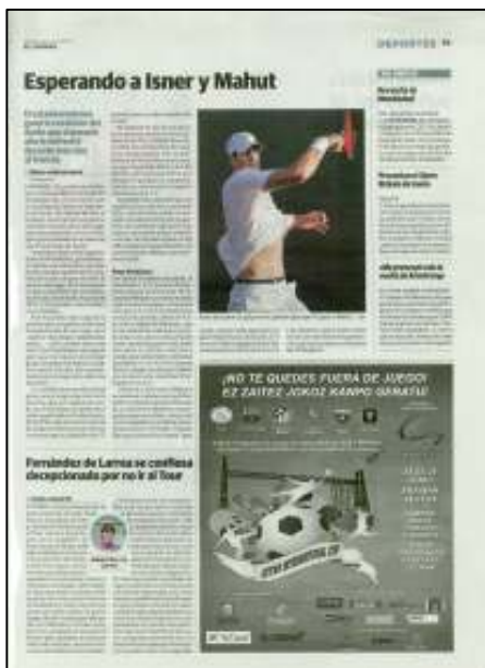
ANUNCIO 15 MÓDULOS. 22/06/2011