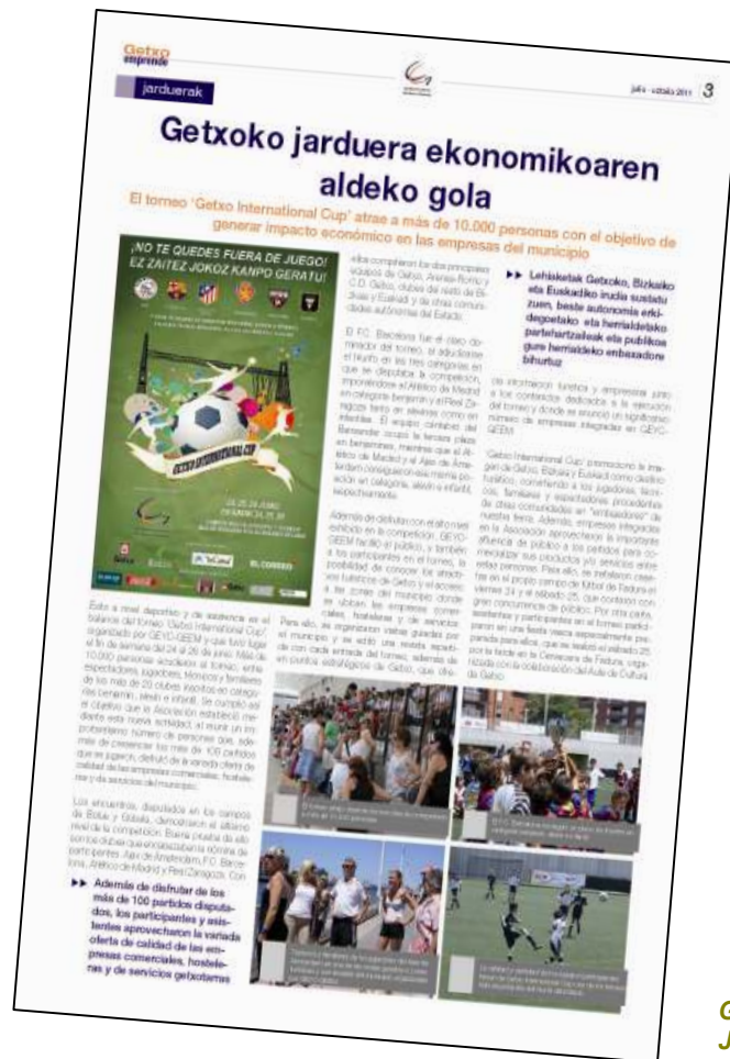
GETXO EMPRENDE Julio 2011