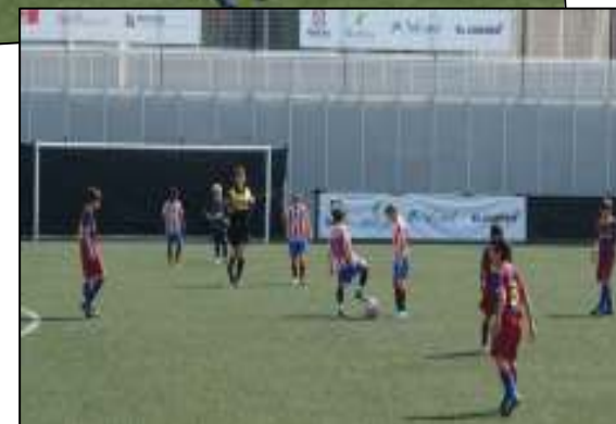
Ajax de Ámsterdam, F.C. Barcelona, Atlético de Madrid y Real Zaragoza fueron los principales equipos participantes de una competición disputada por una veintena de clubes de Getxo, Bizkaia, el resto de Euskadi y otras comunidades autónomas