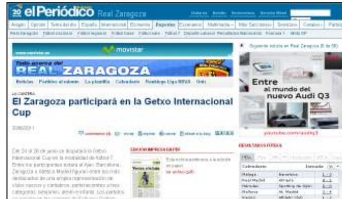
EL PERIODICO DE ARAGÓN.COM 20/06/2011