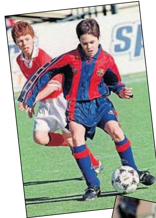
Andrés Iniesta y Fernando Llorente, en su etapa en las categorías inferiores del F.C. Barcelona y el Athletic de Bilbao

Impulsada por la etapa dorada que vive el fútbol de cantera, la Getxo International Cup nace con el espíritu de ser un escaparate de las estrellas del futuro .