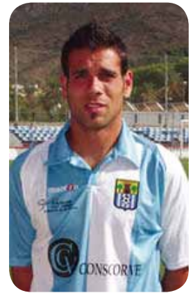
DURAN , interior esquerr que cerca l'un contra un i té arribada a àrea.

- En lliga ha aconseguit una diferència de gols de +25, per + 27 el Constància. - Ha guanyat 22 partits per 23 el Constància. - Ha perdut 4 partits per 6 el Constància. - Ha estat l'equip menys golejat del seu grup amb 23 gols per 25 el Constància.