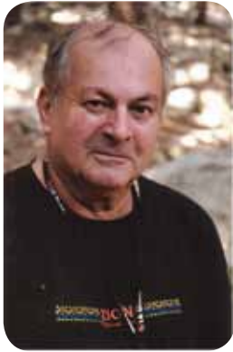
Por Miguel Vidal (*)

“Ser seguidor del Constància, era una tarea a la que nos dedicábamos la mayoría de jóvenes de la part forana, orgullosos de tener un clavo ardiente al que agarrarnos ante el implacable empuje de ciutat”.