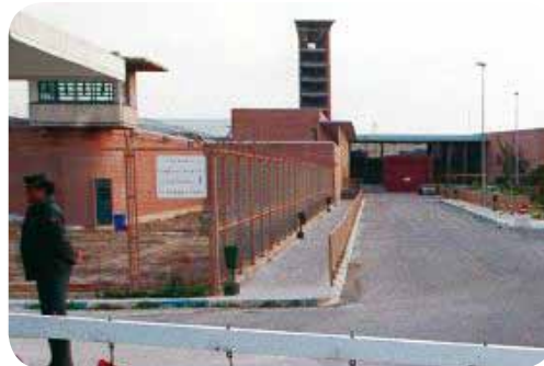
“Alhaurín de la Torre també és coneguda per la presó que hi ha al seu terme municipal i que duu el mateix nom”

- Alhaurín de la Torre està situat a 18 kms. de Màlaga, a la comarca del Valle de Guadalhorce. - Als anys 90 va augmentar de població considerablement degut a l'expansió de l'àrea metropolitana de Màlaga i conta avui amb més de 35.000 habitants. - Tradicionalment la seva economia ha estat centrada en la producció agrícola.