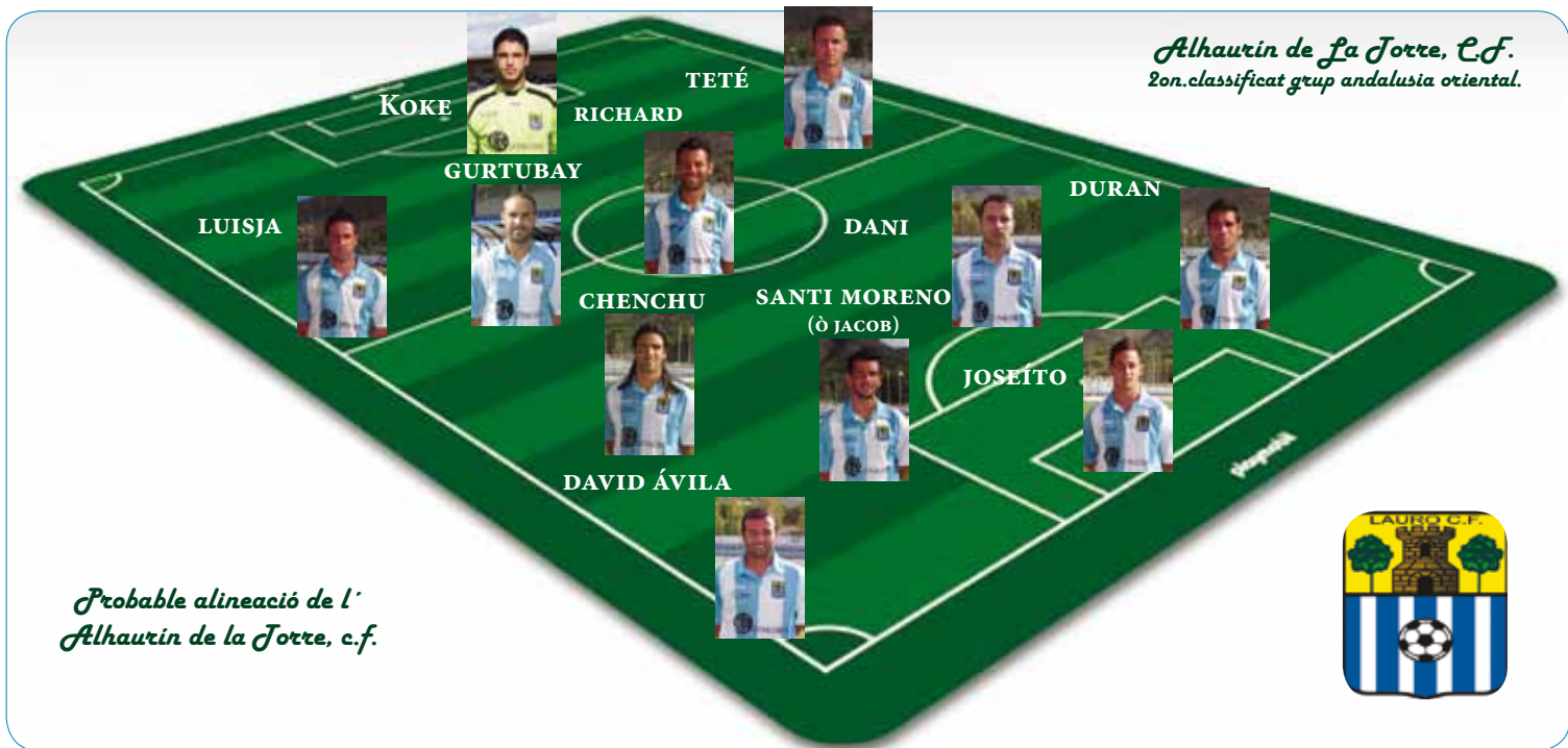
Alhaurín de la Torre, C.F. 2on.classificat grup andalusia oriental.