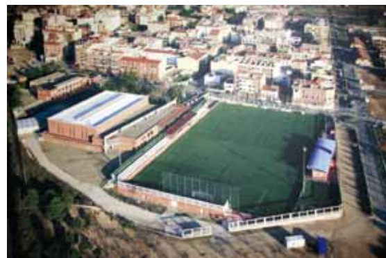
“Vista aèrea del poliesportiu de L.P. de Mafumet”