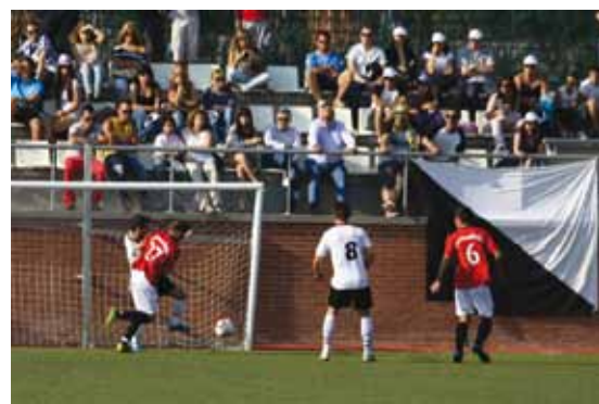
“Afcionats constanciers al partit”