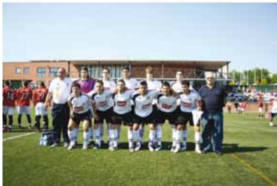
“Onze del Constància a L.P. de Mafumet”