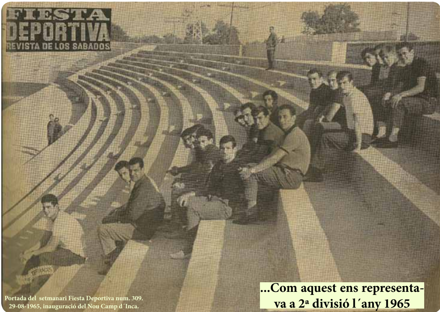
Portada del setmanari Fiesta Deportiva num. 309. 29-08-1965, inauguració del Nou Camp d'Inca.

...Com aquest ens representa va a 2ª divisió l'any 1965