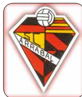
Escut de la Penya Arrabal