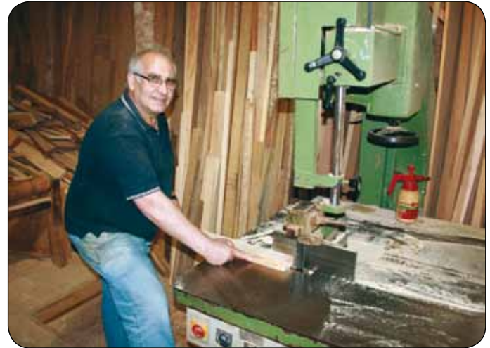
"El fuster de Llubí fa ja 11 anys que és el delegat del Constància"