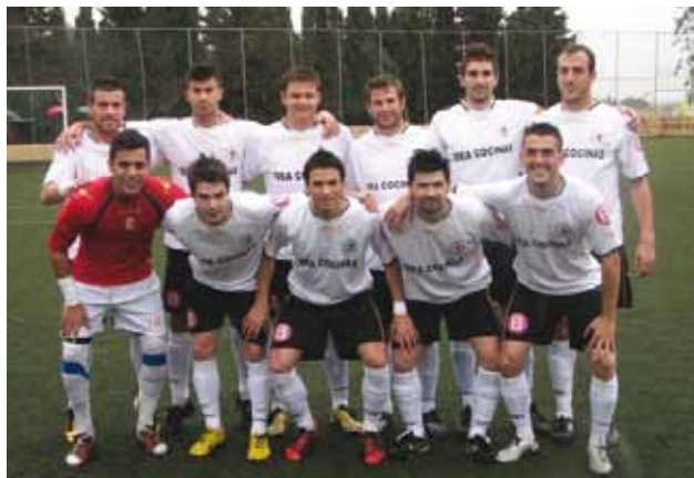
Onze recent del Llosetense