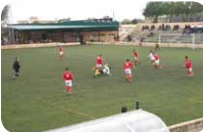
Municipal de Lloseta