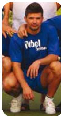
Xino, ex Constancia