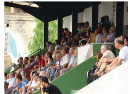
Grada principal de l'estadi "Sant Bartomeu" de Ferreries.