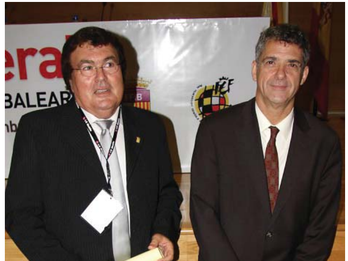
Bestard amb Angel Mª Villar president de la Reial Federació Espanyola de Futbol

clubs i en el dia a dia, a més aconseguir també que les persones relacionades amb la FFIB creguessin en nosaltres i en la nostra feina. Pens que avui la relació entre clubs i institucions també funciona. A pesar d'haver passat 7 anys des de que va partir l'anterior president, feim feina amb el mateix pressupost que hi havia en la seva època, aconseguint fer moltes coses amb els mateixos doblers com proveir de desfibriladors a tots els clubs i en el dia a dia, a més aconseguir també que les persones relacionades amb la FFIB creguessin en nosaltres i en la nostra feina. Pens que avui la relació entre clubs i institucions també funciona. A pesar d'haver passat 7 anys des de que va partir l'anterior president, feim feina amb el mateix pressupost que hi havia en la seva època, aconseguint fer moltes coses amb els mateixos doblers com proveir de desfibriladors a tots els