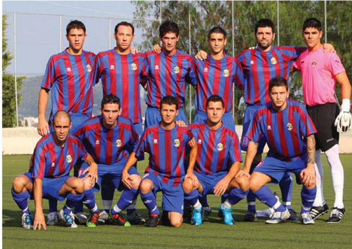
“Onze del Ferreries a la temporada 2010-11”