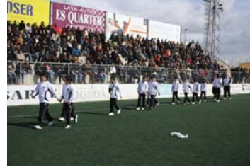
Ambient a les grades.

Finalment i després d'un intent al Desembre passat frustrat per el mal temps, dimarts dia 1 de Març dia de les Illes Balears, es va poder dur a terme la presentació del futbol base d'Inca. Parlament del batle i president del futbol base, bon ambient a la tribuna i desfilada dels diferents equips van donar cos a l'acte.