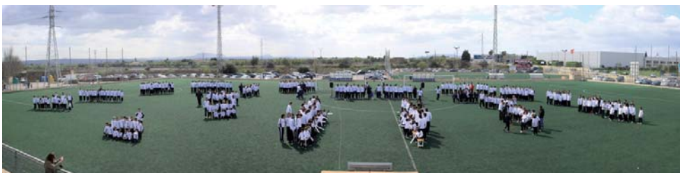
Imatge panoràmica dels diferents equips presentats el dia 1 de Març