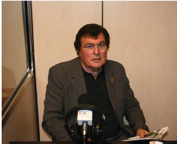
El president de la FFIB a “Constanciers a sa Ràdio”

El club inquer, és un club a tenir molt en compte i a respectar.