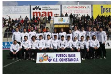
Divisió d'honor juvenil