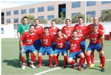
Onze recent del Collerense