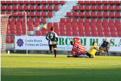
Momento en que se produce la lesión del meta

“Una gran temporada que llega a su fin anticipadamente debido a la lesión”