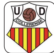
Escut del Collerense