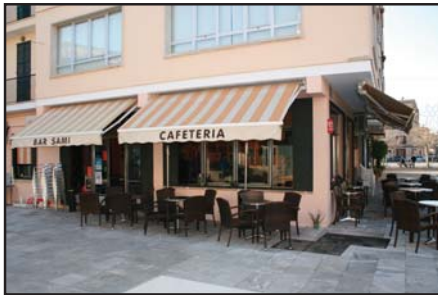
Façana del Bar Sami a Muro

Troba "Constanciers" els divendres de partit com a local als següents punts: