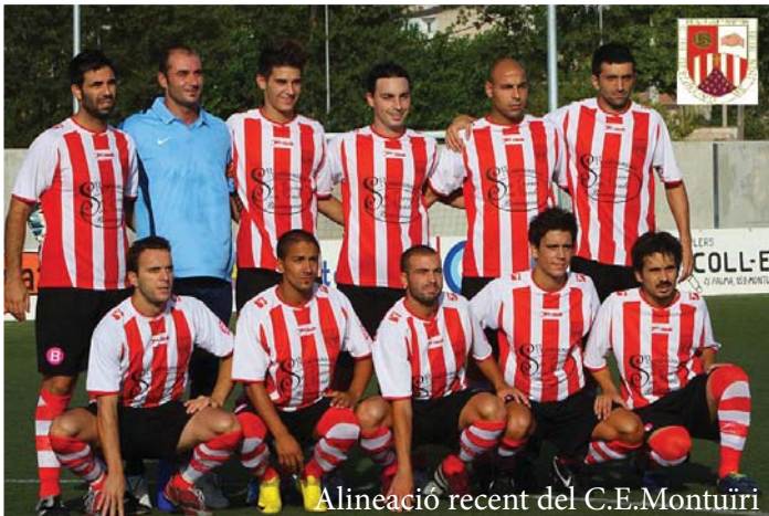
Alineació recent del C.E. Montuïri