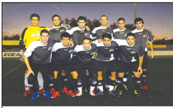
Alineació del Jov. Sallista a Gramanet.