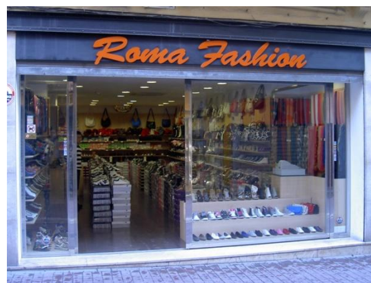
Exactament en aquest indret del carrer del Sindicat, s'ubicava el Bar Pasaje