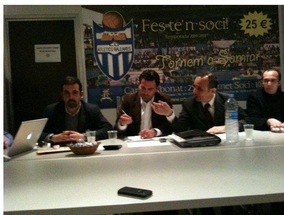
Assemblea Extraordinària de Socis del Club Esportiu Atlètic Balears

A les oficines de l'Estadi Balear es va celebrar Assemblea Extraordinària de Socis del Club Esportiu Atlètic Balears a la qual varen assistir gairebé 80 socis de l'entitat.